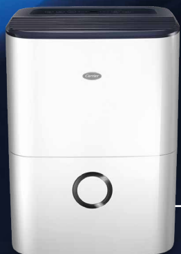
NextGen II: 16 & 20 Lt