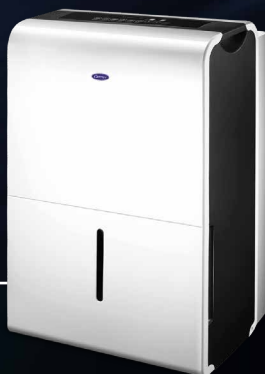
NextGen III: 30 & 50 Lt