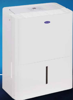
NextGen I: 10 & 12 Lt