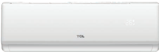
ELITE PREMIUM III