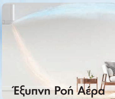
Έξυπνη Ροή Αέρα