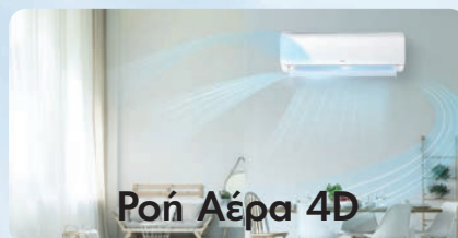
Ροή Αέρα 4D